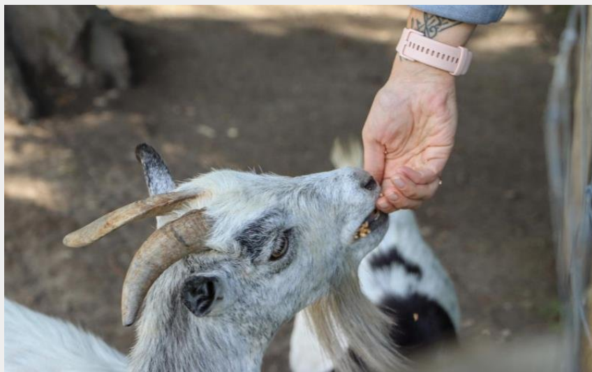
Crédit photo : Gîte de France Le Gué Hersant (© Gîtes de France Orne)