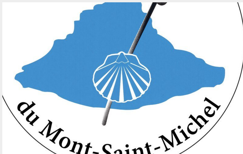
(Les Chemins du Mont-Saint-Michel)