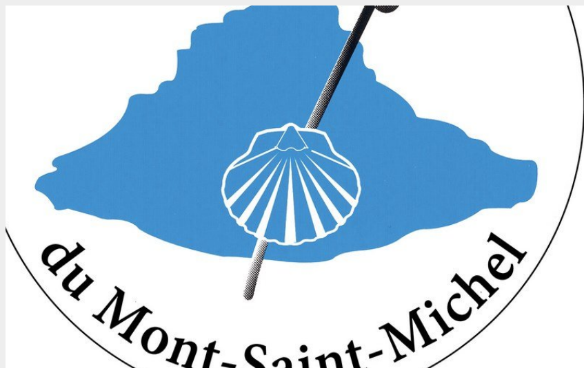
(Les Chemins du Mont-Saint-Michel)