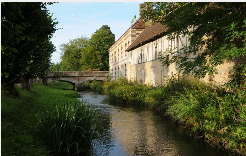
Le Pont Rouge de Longny-au-Perche