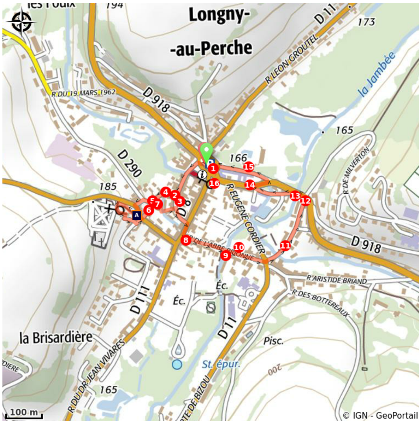
La chapelle Notre-Dame de Pitié (A)