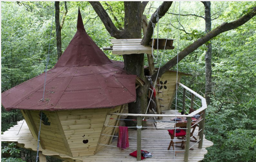
Cabane du Bois Landry

Communauté de Communes Terres de Perche - Combres