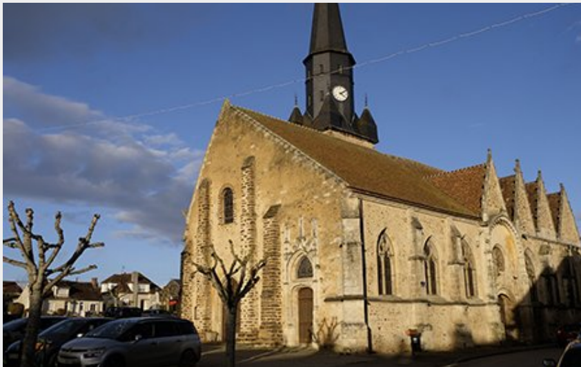
Eglise Saint-Jean-Baptiste-La Bazoche Gouët (admin-pnrp)