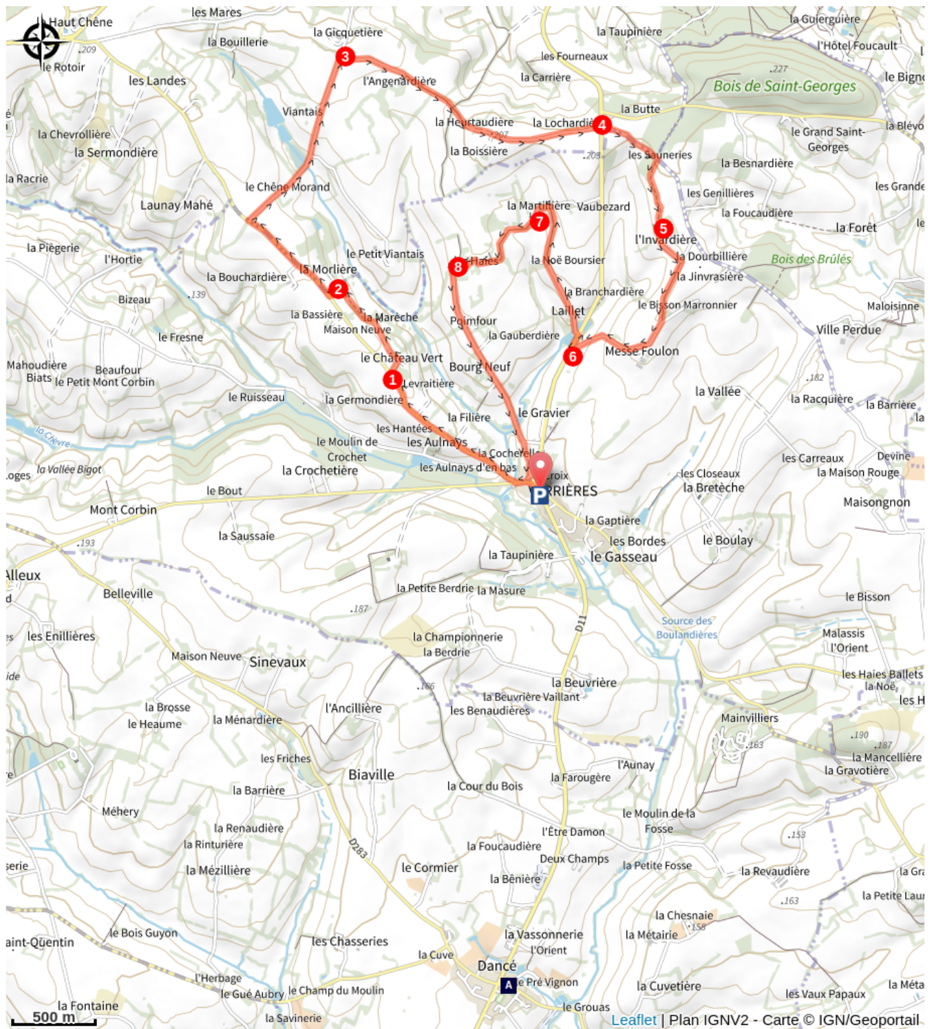
L'église Saint-Jouin de Dancé (A)