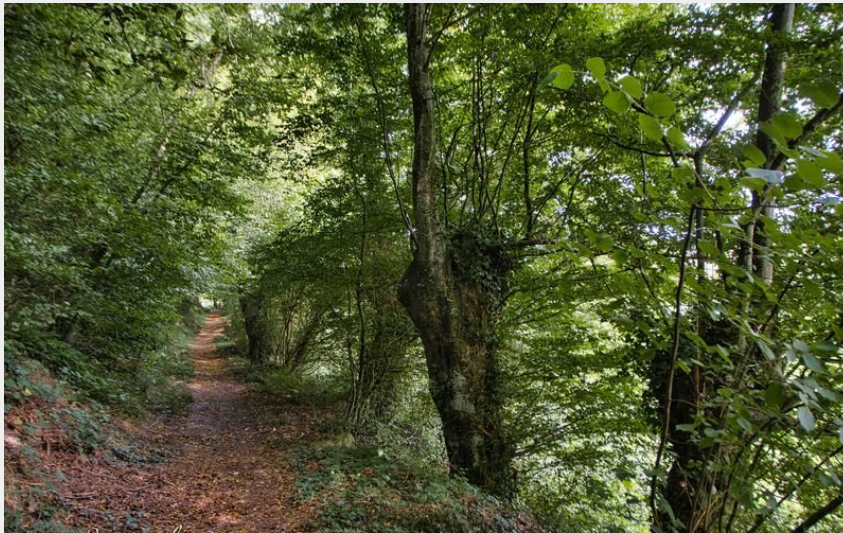
Les trognes en arrivant sur La Bassière