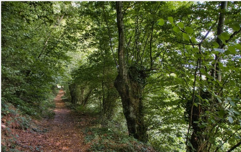
Les trognes en arrivant sur La Bassière