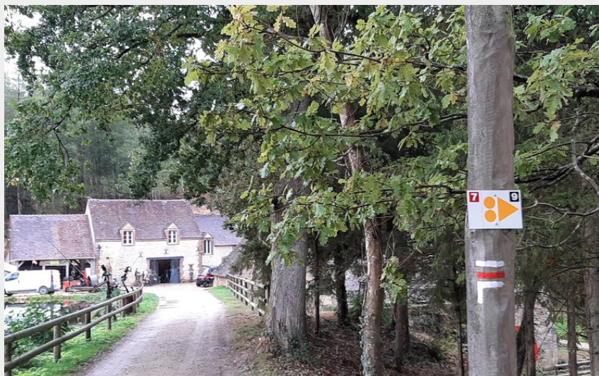
La Brasserie du Perche

Communauté de Communes des Hauts du Perche