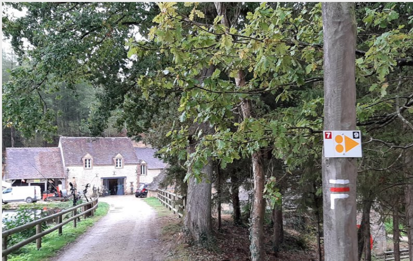
La Brasserie du Perche