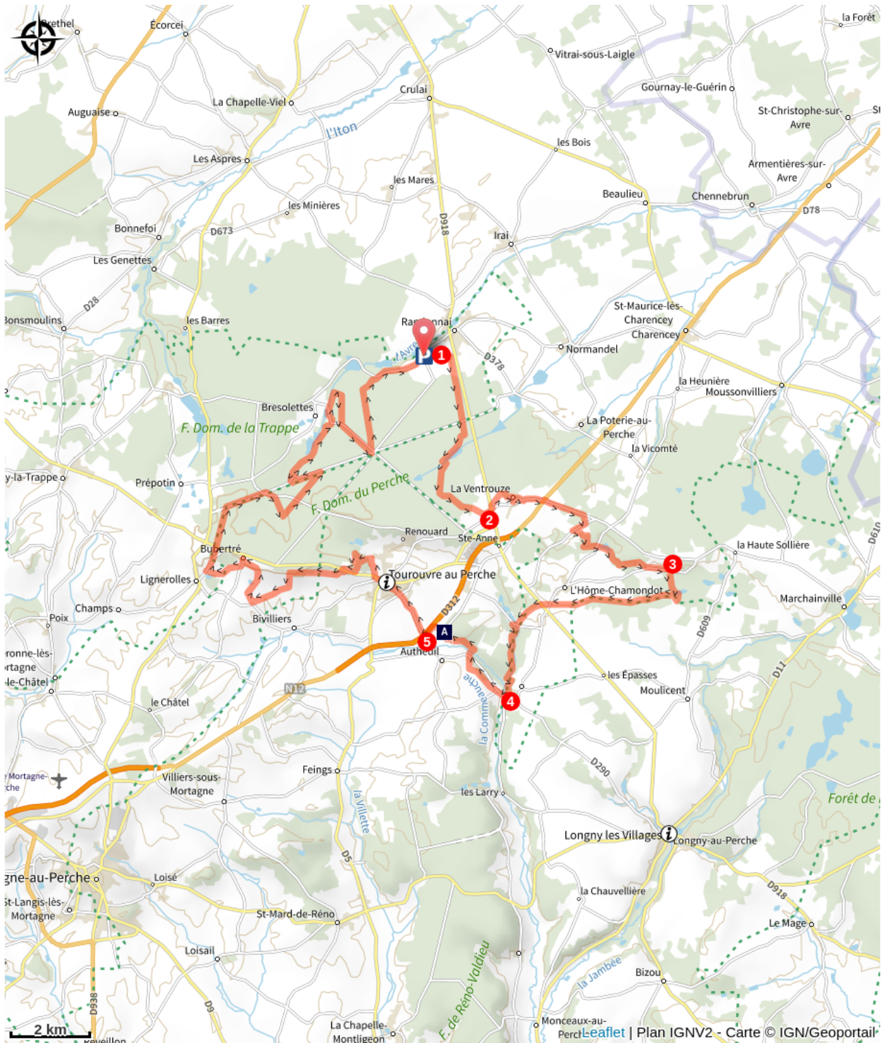
Le Manoir de Bellegarde (A)