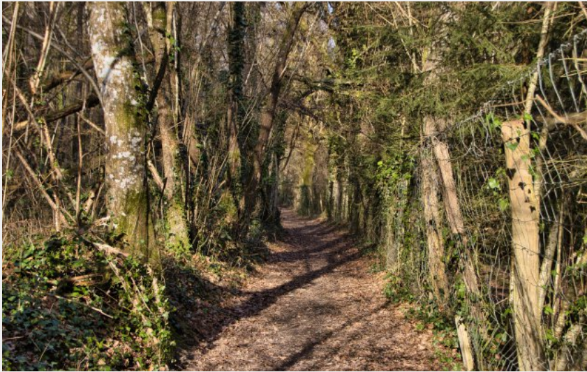
Du côté de Malétable