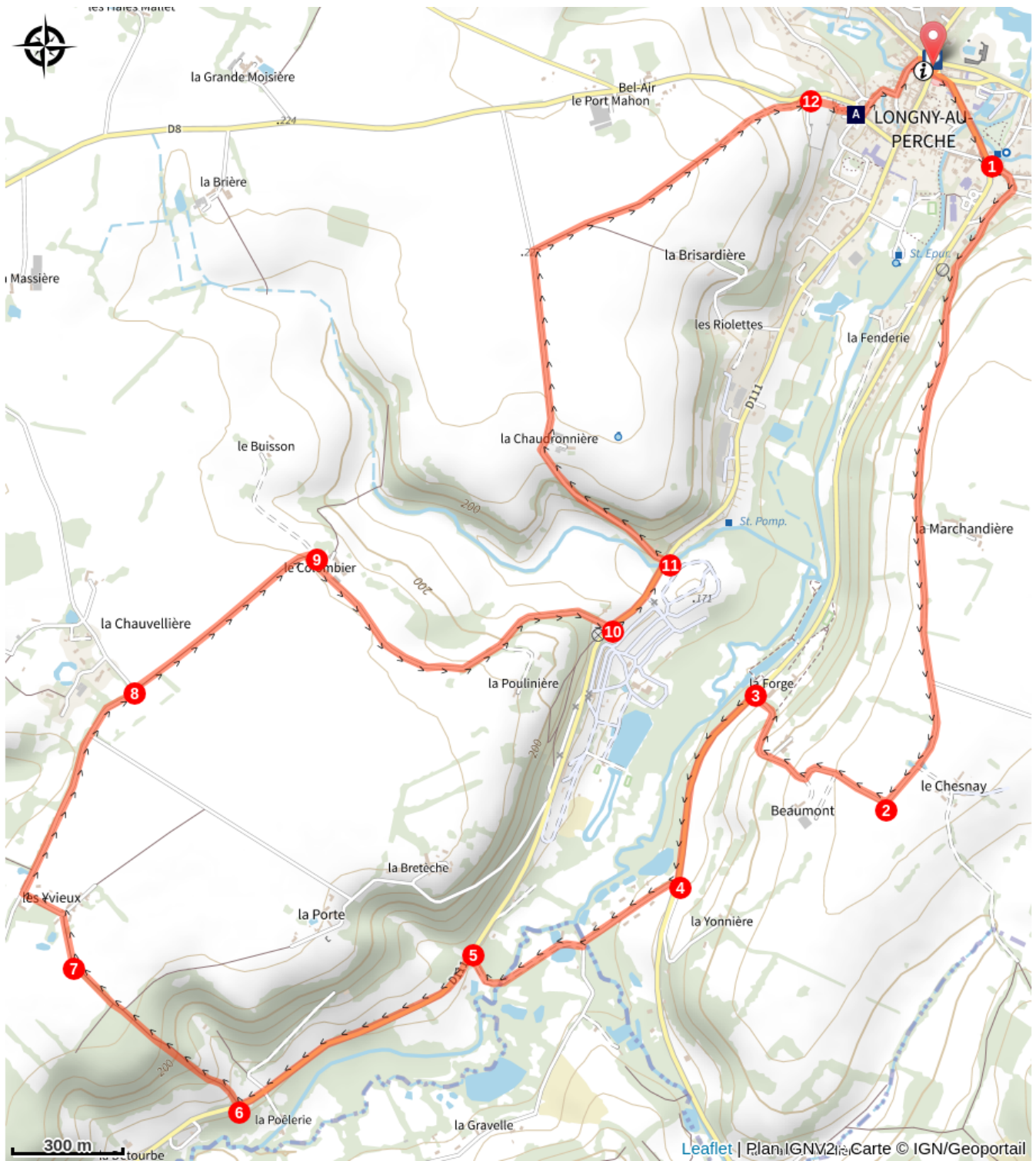
La chapelle Notre-Dame de Pitié (A)