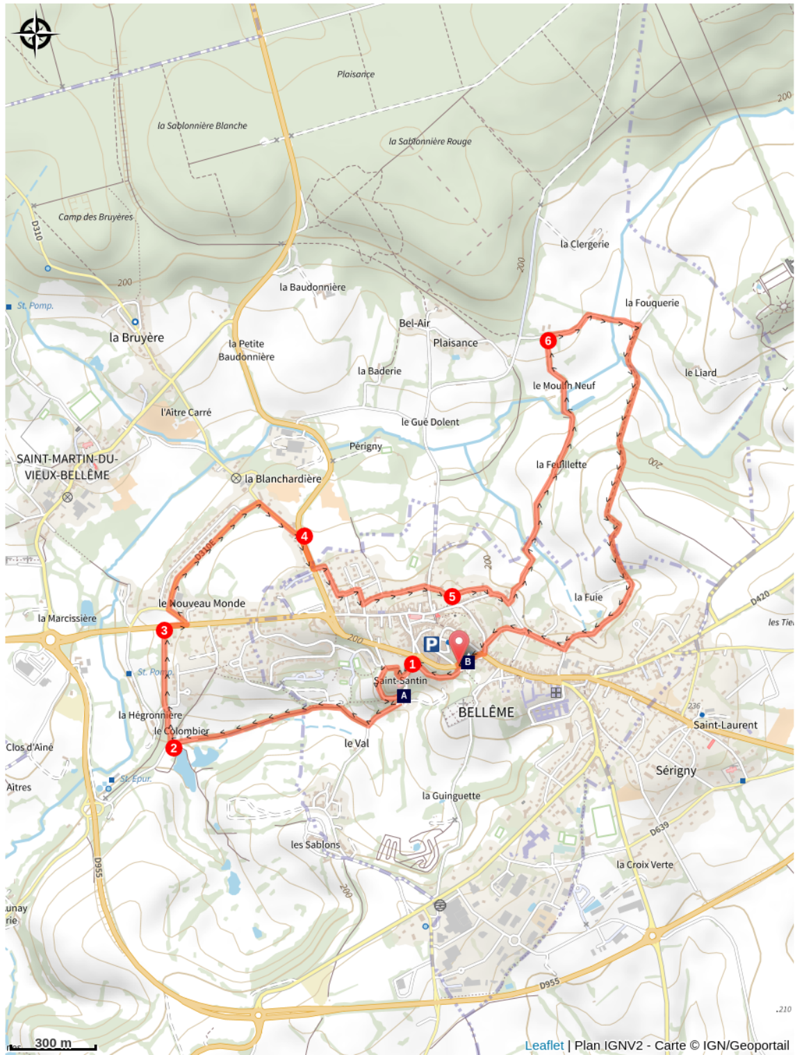
La Chapelle Saint-Santin (A)