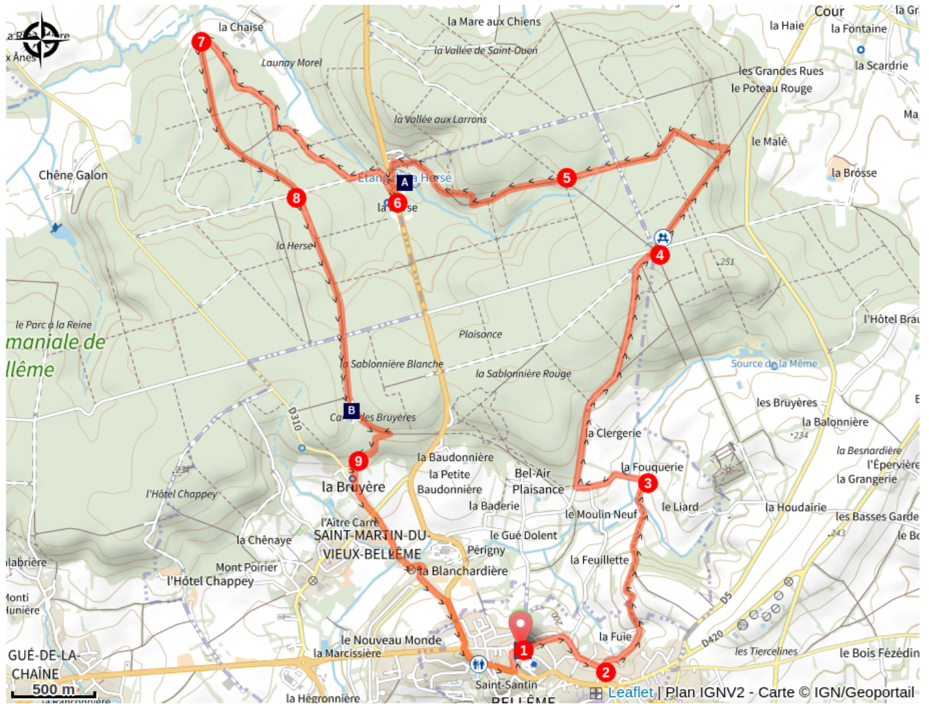
Étang de la Herse (A)