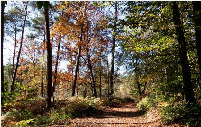
Forêt de Bellême