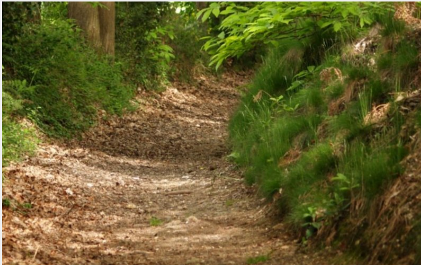
Par les chemins... (Maison du tourisme-Collines du Perche Normand)