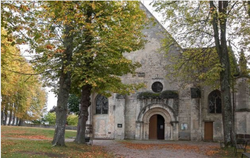
Eglise St Germain

Communauté de Communes Cœur du Perche - Rémalard