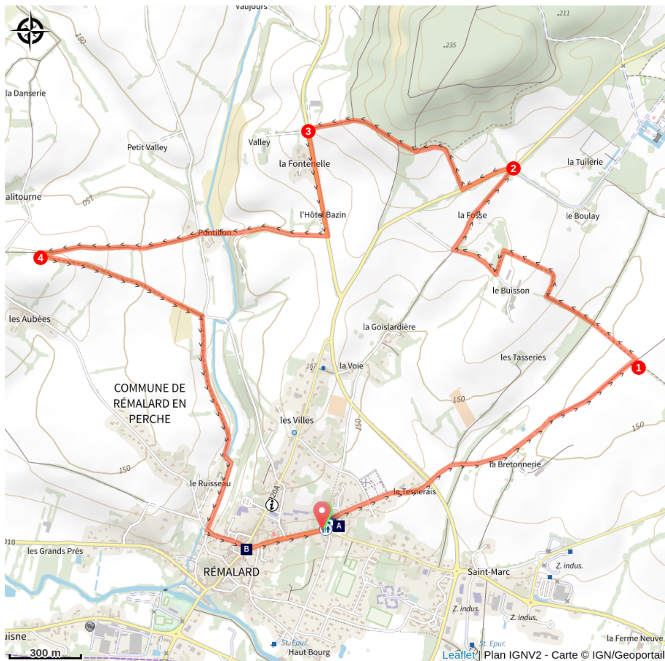
Église Saint-Germain-d'Auxerre (A)