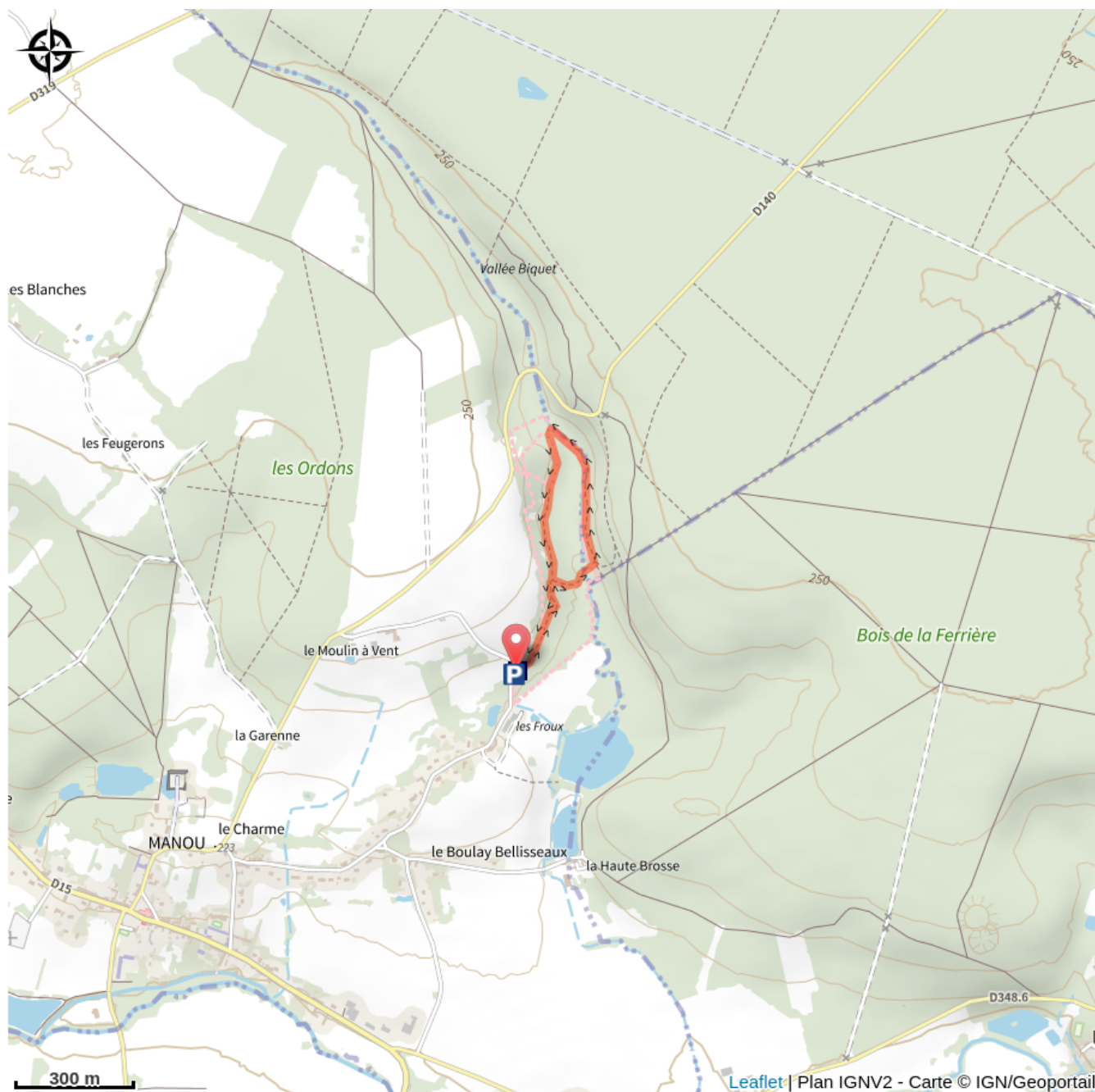
La tourbière des Froux (A)