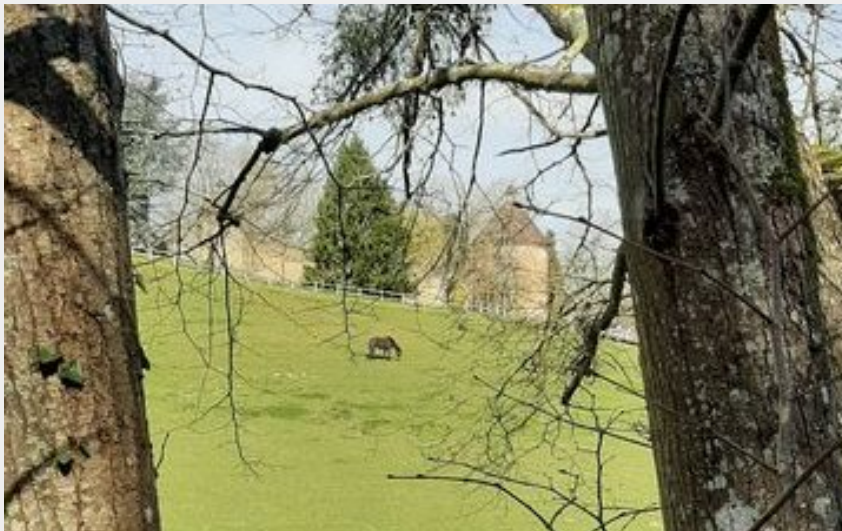
En fond, le château de Beauvais