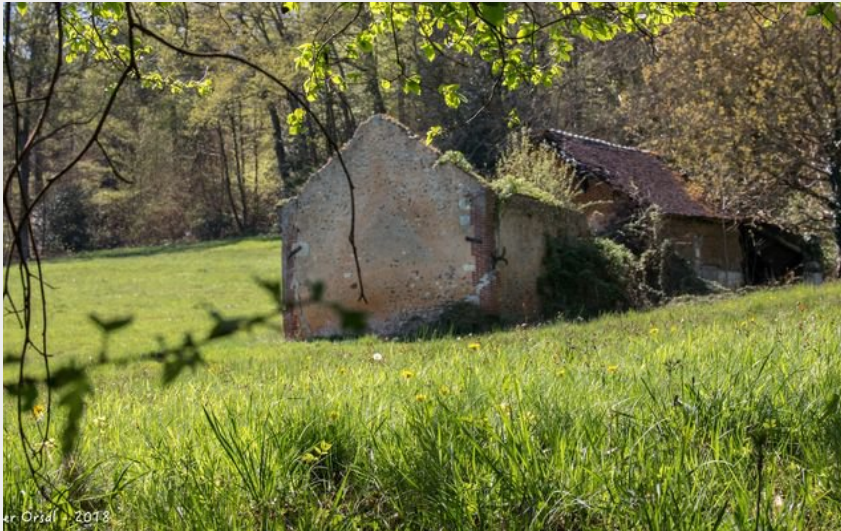
Lieu dit "Hotel Garnier"