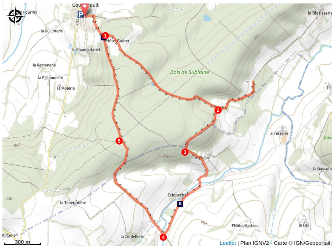
Le Bois de Sublaine (A)