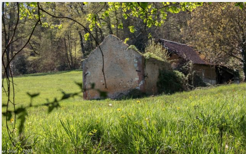
Ar. Orjal - 2013 Lieu dit "Hotel Garnier"