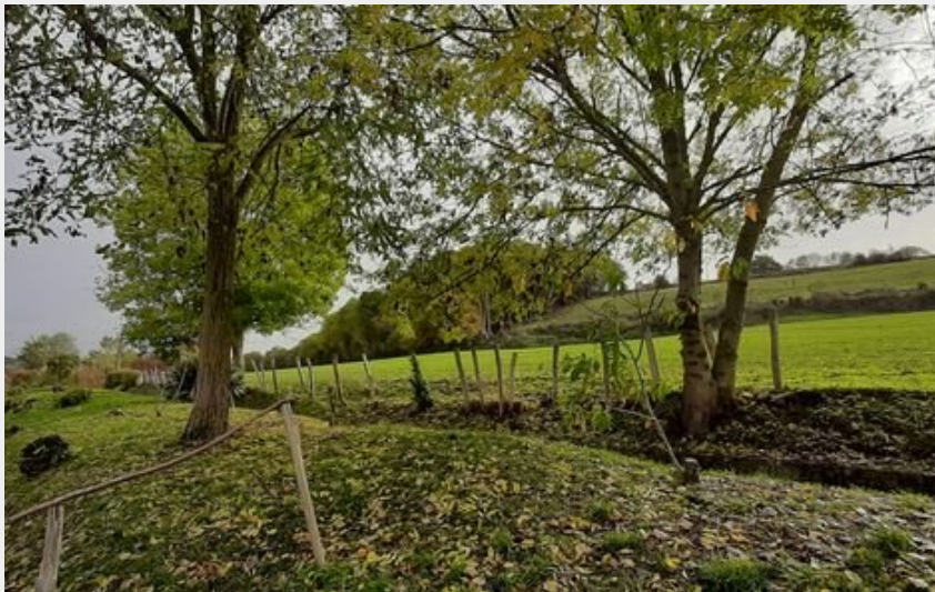
Depuis le canal d'Arcisses