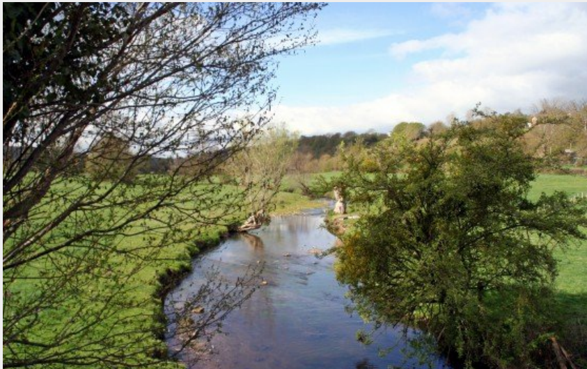
La Corbionne près de Rivray