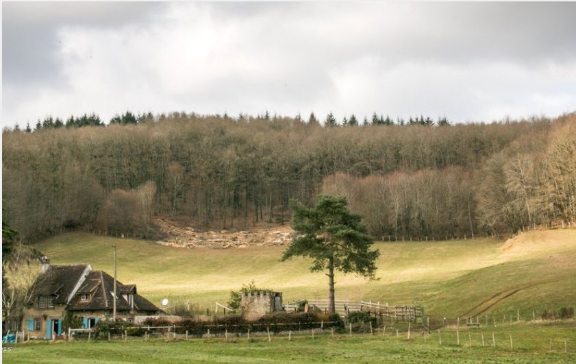
Sur les hauteurs de Bretoncelles (Didier Orsal)