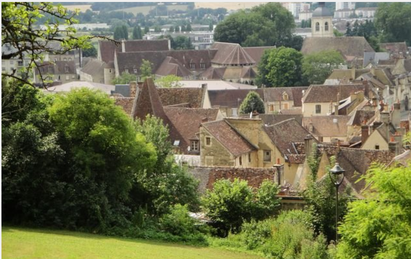
Le quartier du Paty