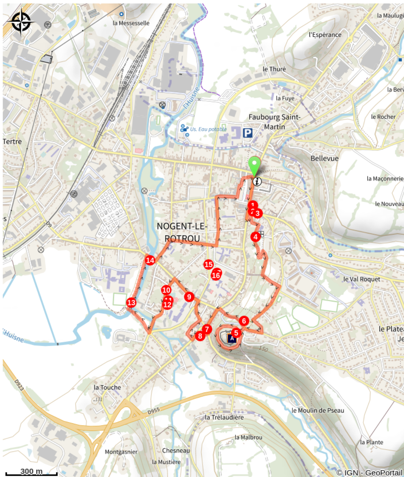
Le Château des Comtes du Perche (A)