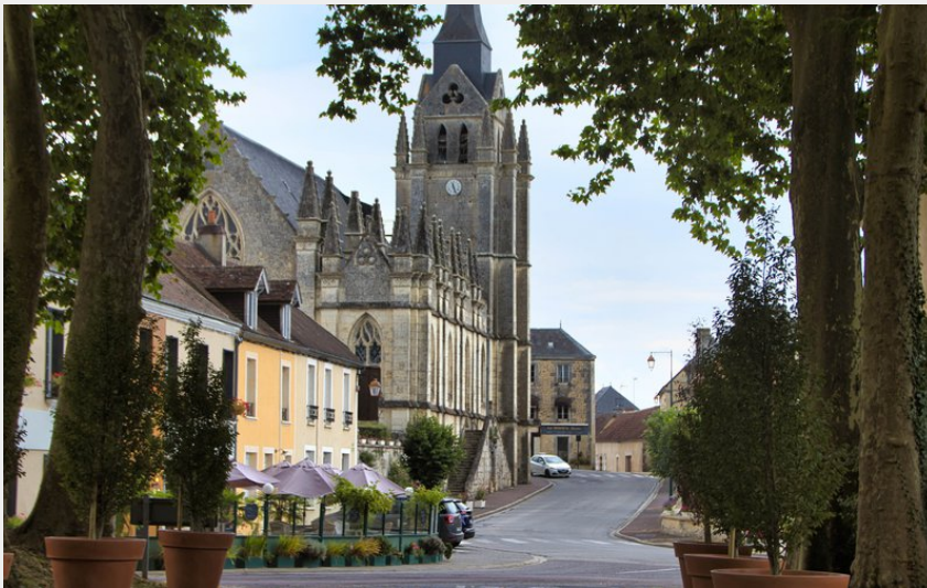
Rue le la Herse, Eglise Saint Barthélémy (Didier Orsal)