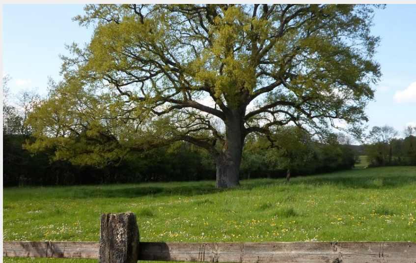
Le gros chêne