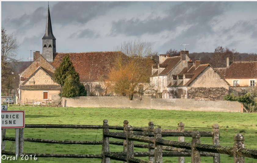
Orsal 2016 Saint-Maurice-sur-Huisne