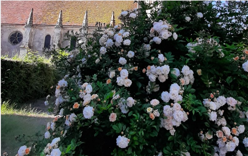
Eglise Notre-Dame de Courgeon