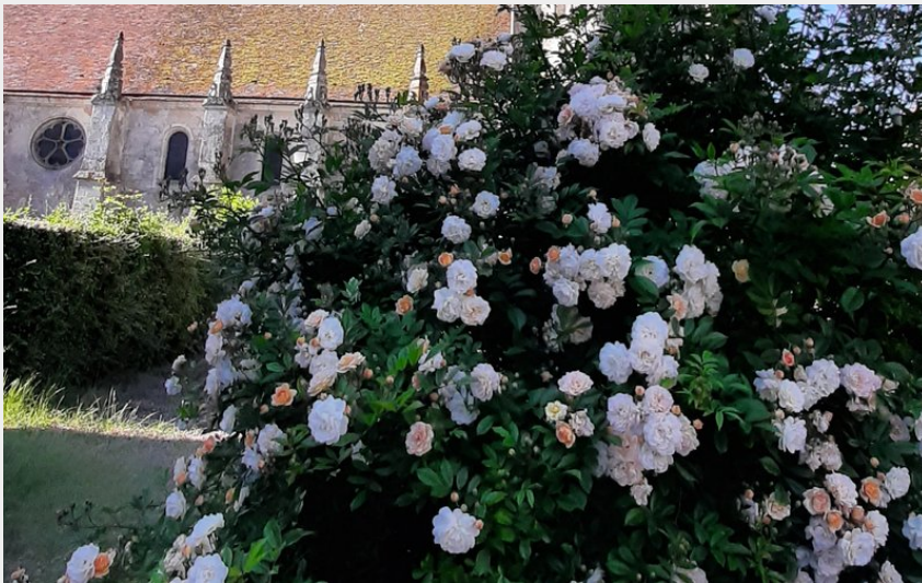
Eglise Notre-Dame de Courgeon