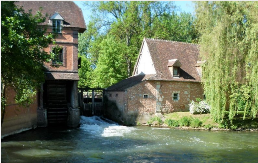
Moulin de Villeray-Condeau