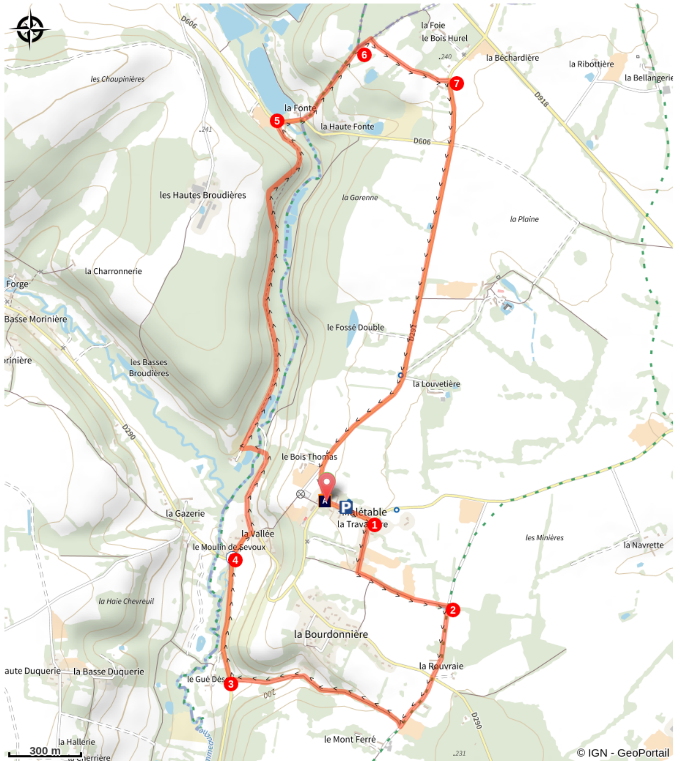
Eglise Notre-Dame de la Salette (A)