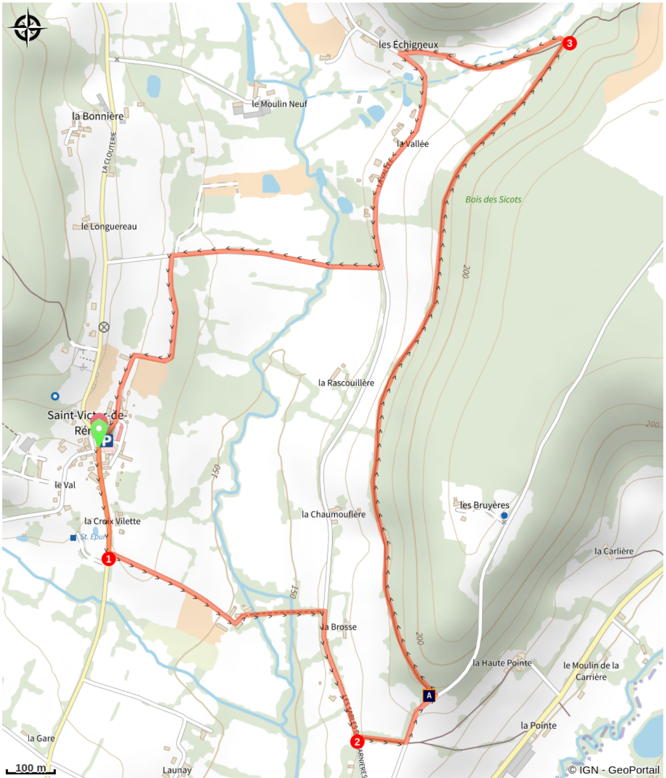
Le bois des Sicots (A)