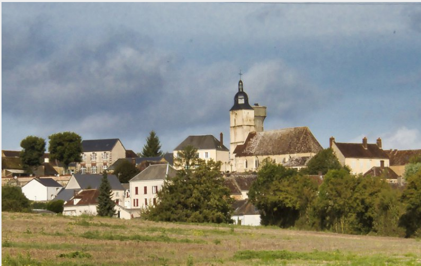
Brunelles (Didier Orsal)