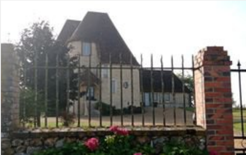
Manoir de Carcahut