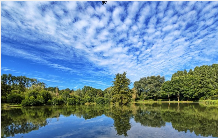
Etang de Vichères