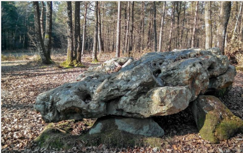
Bois de St Laurent