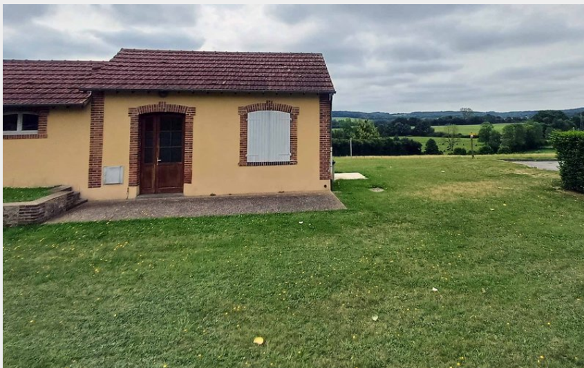
Départ des randonnées, ancienne gare du Mage (C Weber)