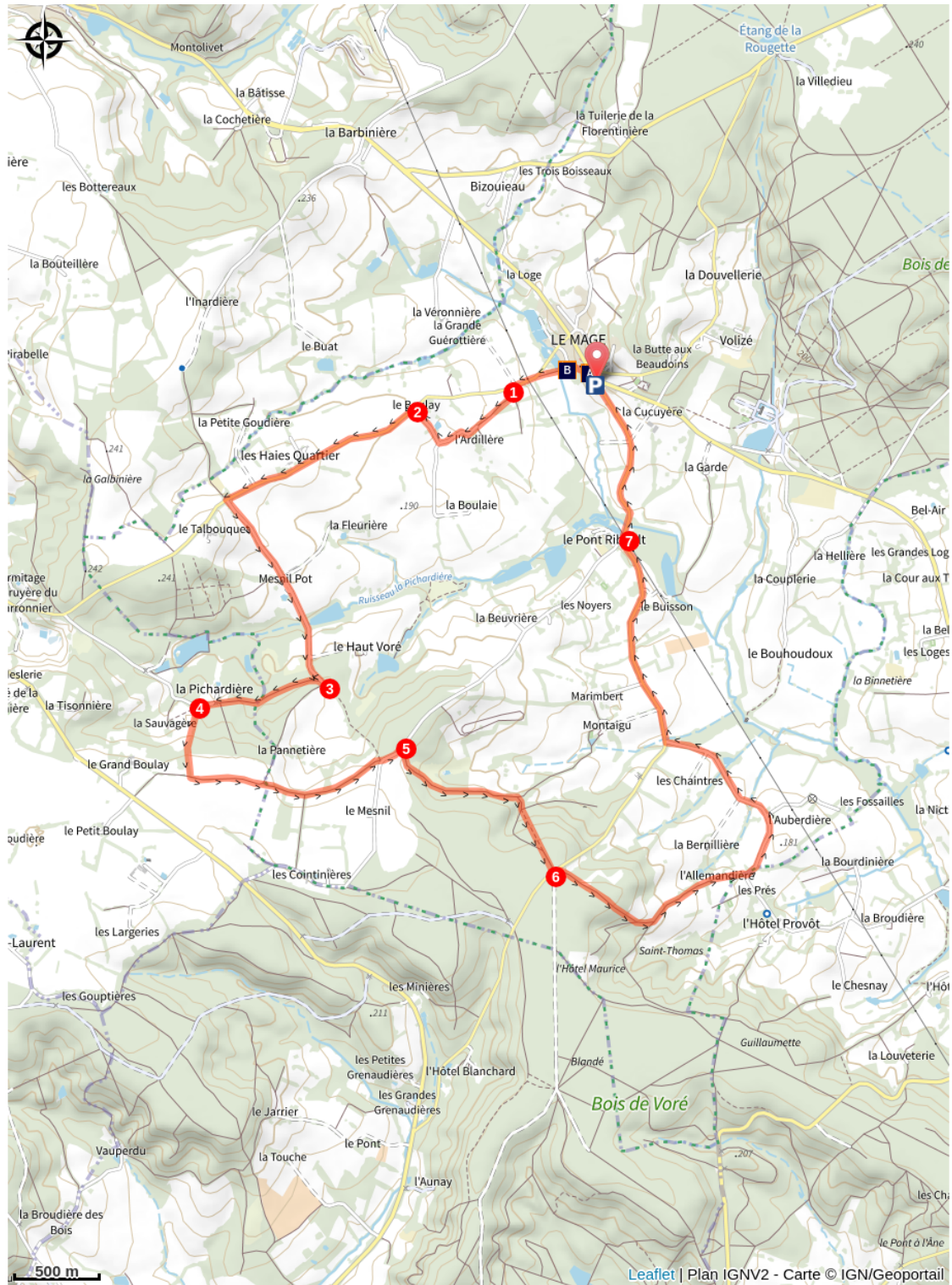
Eglise Saint-Germain-d'Auxerre (A)