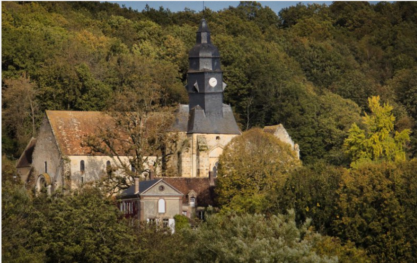
Notre Dame du Mont Harou (Didier Orsal)