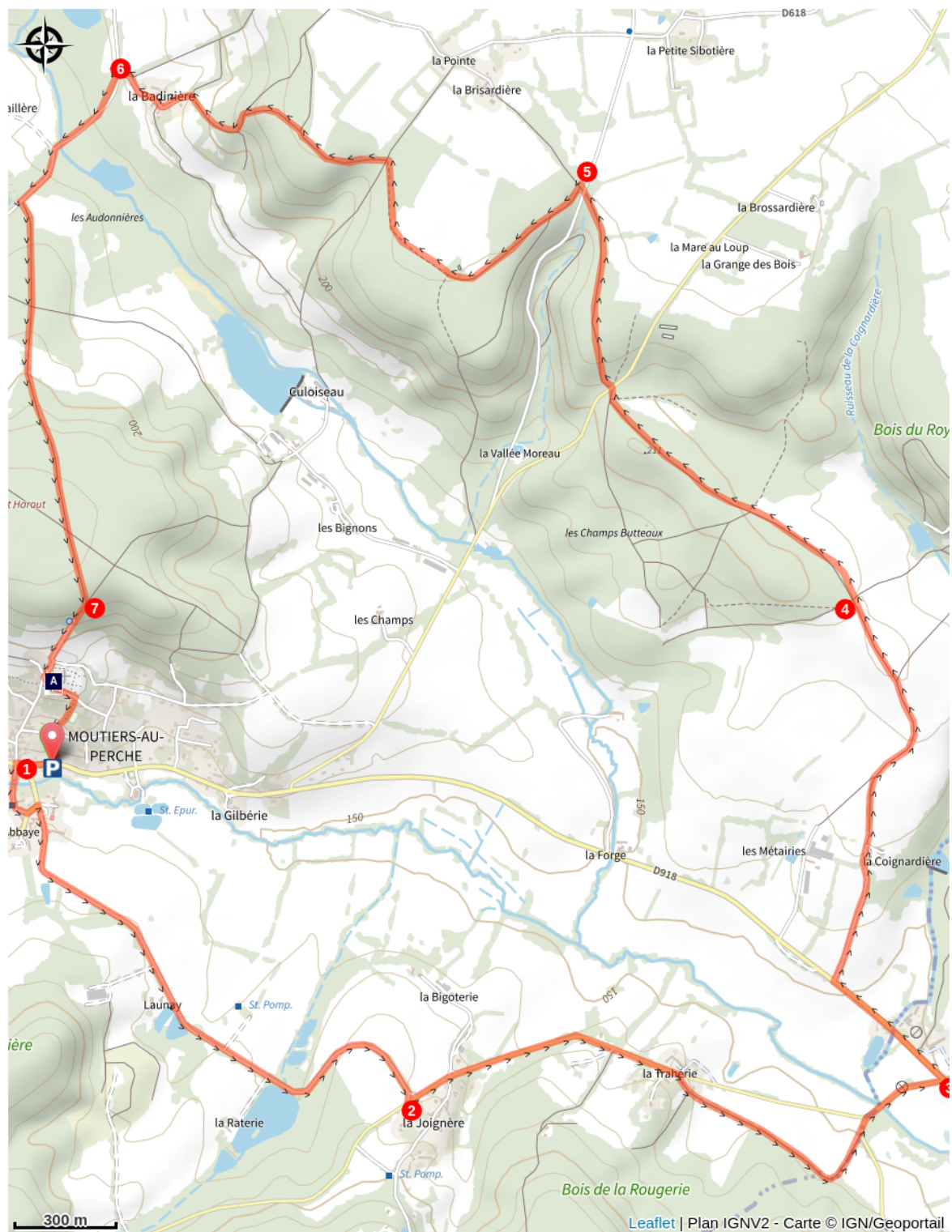
Guide de visite du bourg de Moutiers-au-Perche (A)