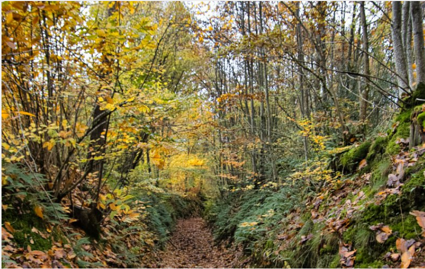
Chemin creux descendant vers La Badinière (Didier Orsal)