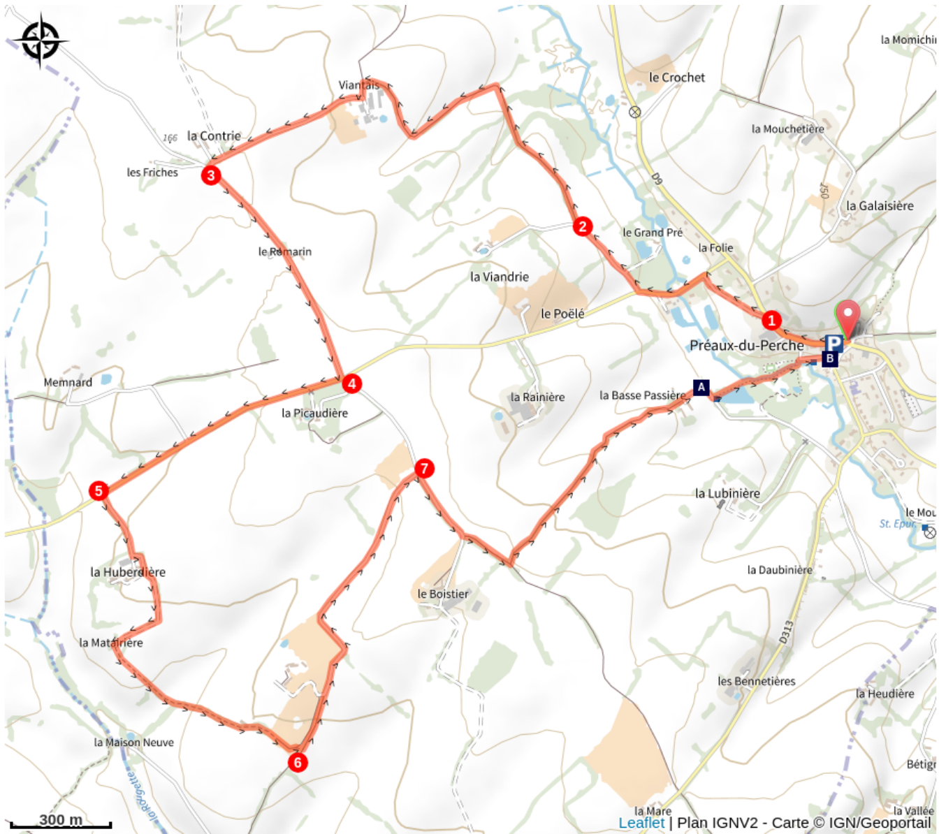
Point de vue (A)