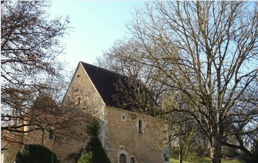
Le manoir à Cholet