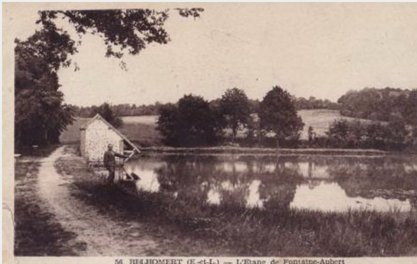
56 BELHOMERT (E.-et-L.) — L'Étang de Fontaine-Aubert