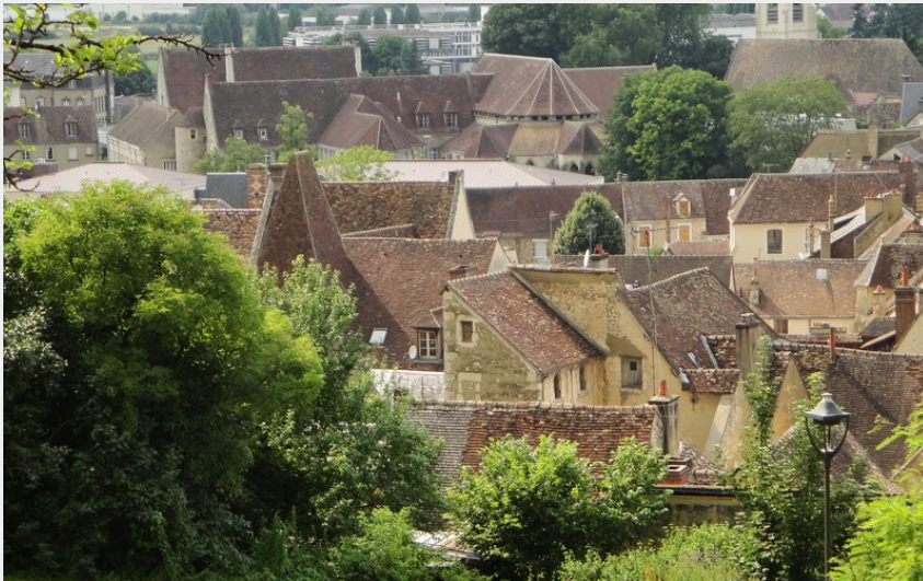
Vue plongeante sur Nogent-le-Rotrou