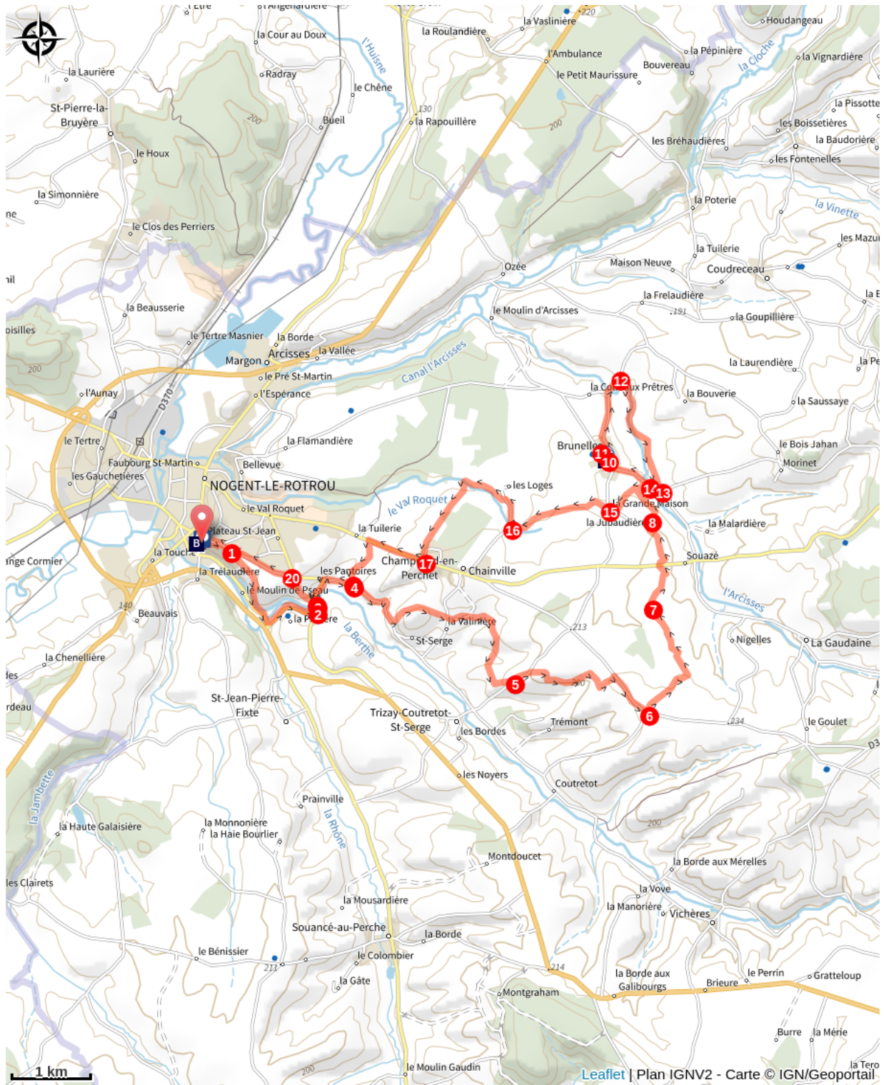
Synthèse communale (A)