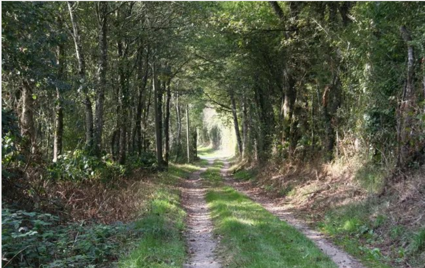
Chemin de César