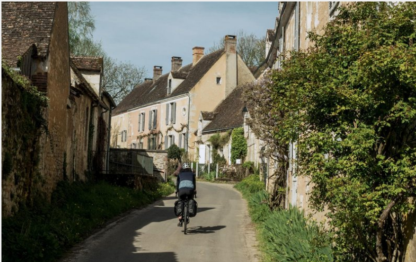
Rues de Villeray