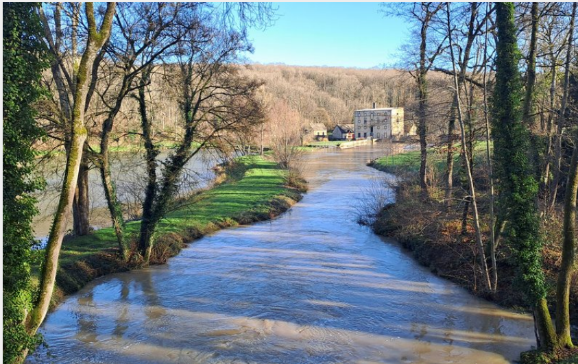
Moulin de Boizard