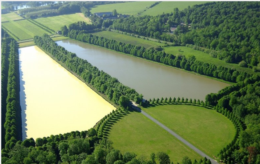
(© Gilles Tordjeman)