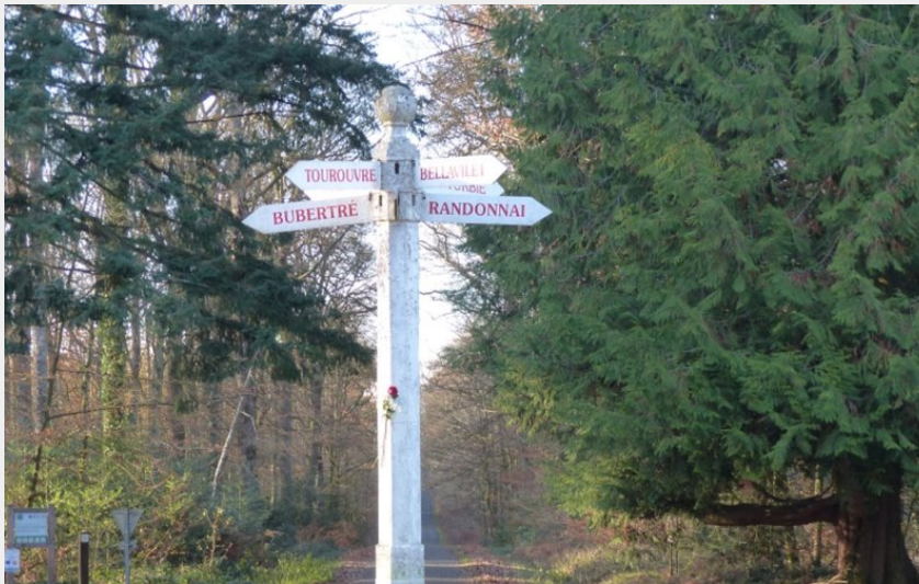
Carrefour de l'Etoile (F.Demeule)