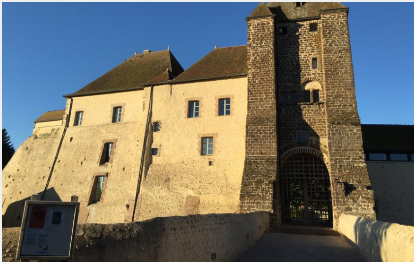
Château de Senonches (N.Desilles)