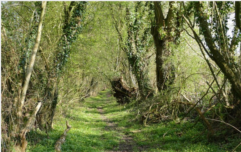
Chemin creux (CdC du Bassin de Mortagne-au-Perche)