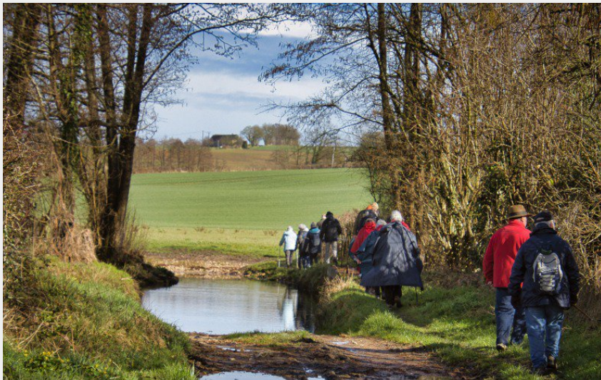
La Rivière "La Cloche" au hameau de La Cloche (Didier Orsal)